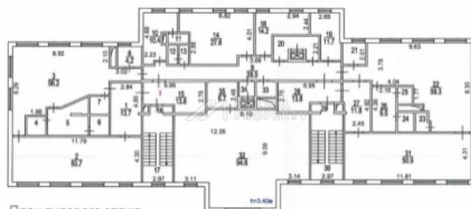
План типового этажа