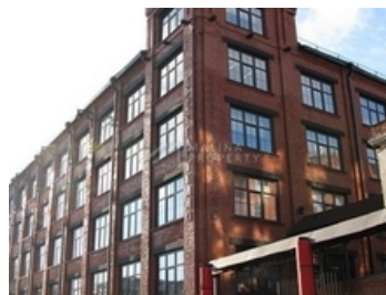
БИЗНЕС-ЦЕНТР КЛАСС В+