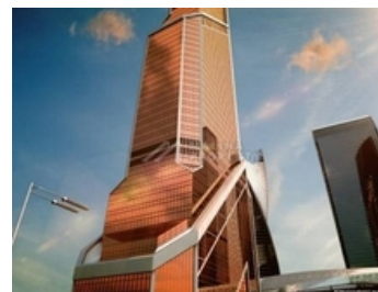
БИЗНЕС-ЦЕНТР КЛАСС А