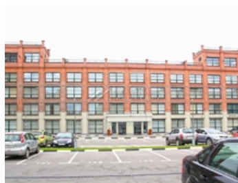
БИЗНЕС ПАРК КЛАСС В+