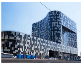
БИЗНЕС-ЦЕНТР КЛАСС А