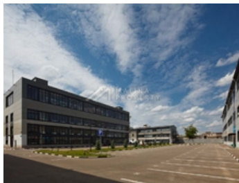
БИЗНЕС-ЦЕНТР КЛАСС В+