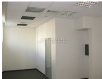
ОФИСНО-ТОРГОВЫЙ КОМПЛЕКС КЛАСС В+