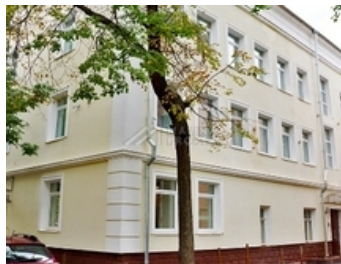
ОСОБНЯК КЛАСС А