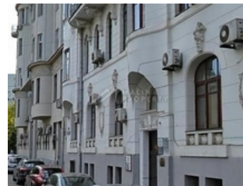
ОФИСНО-ЖИЛОЙ КОМПЛЕКС КЛАСС В+