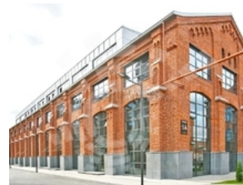
АДМИНИСТРАТИВНОЕ ЗДАНИЕ КЛАСС В+