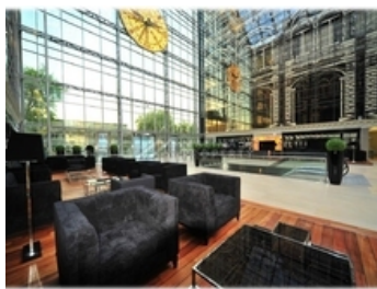
БИЗНЕС-ЦЕНТР КЛАСС В+