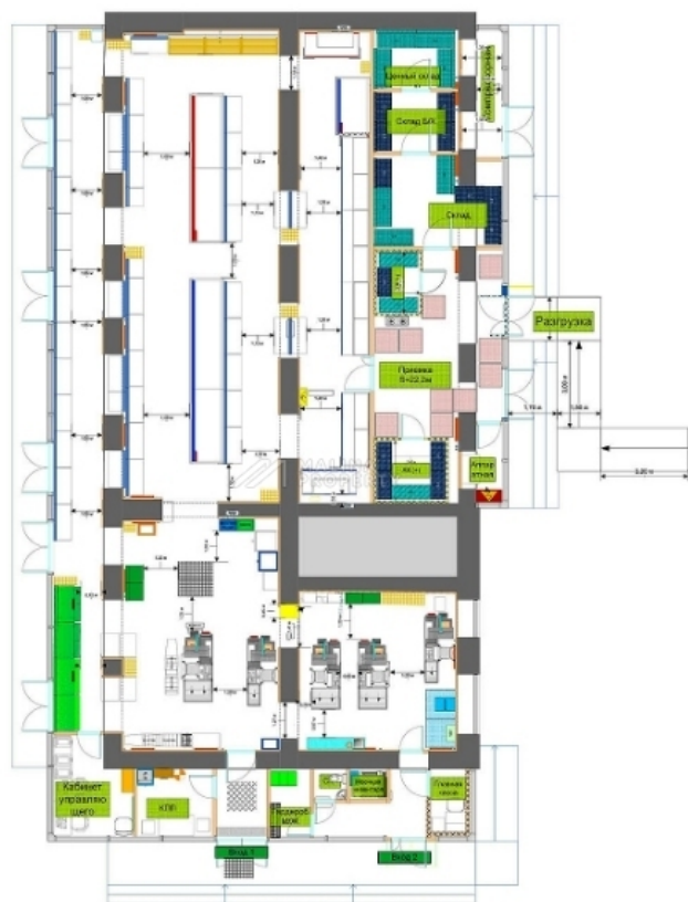
Площадь: 399,6 м 2