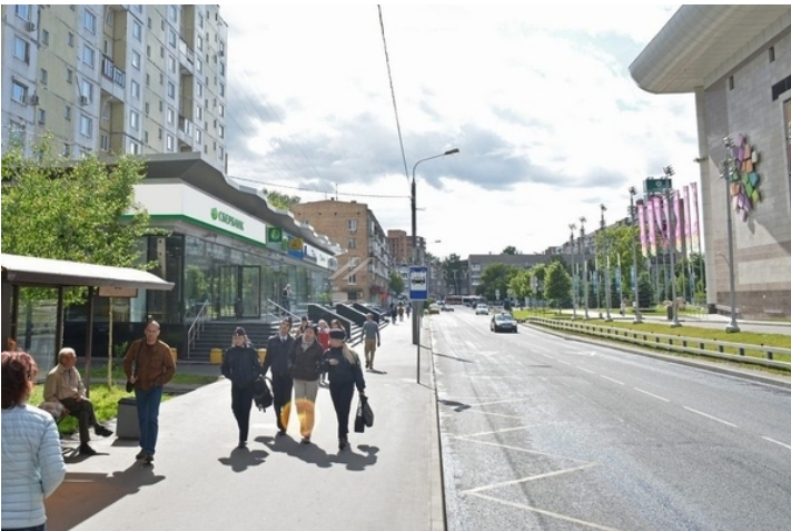
Галерея «РАДУГА» - Метро «Сходненская» - Химкинский бульвар д.21